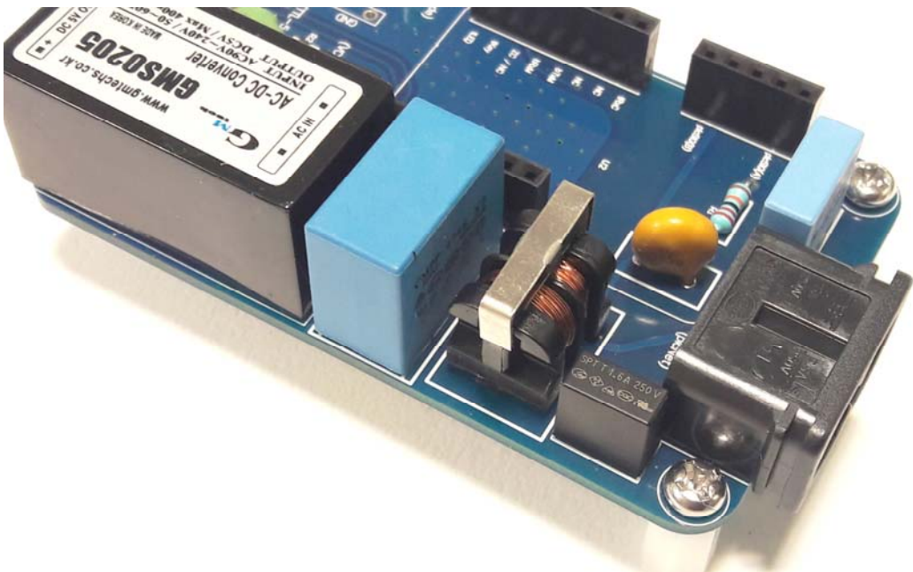
plcKit제품에 장착된 사진