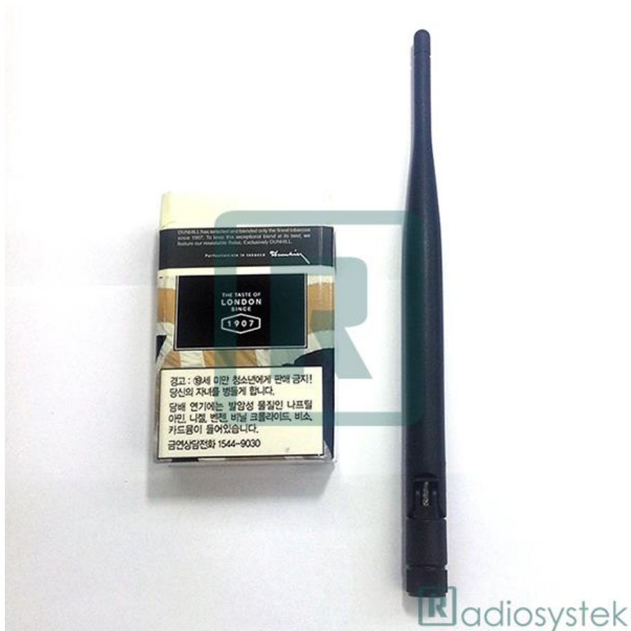
400 MHz Antenna, RST435.5V-2, 424 MHz 447 MHz 지원